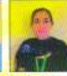
Jashan 2nd Position