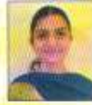
Palak 3rd Position