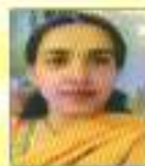
Tammana 1st Position