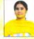
Harsh 3rd Position