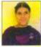
Harman 2nd Position